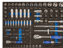
Vasos y puntas en foam 3/3 (94 piezas) IFF1A001