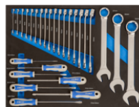
Llaves combinadas y destornilladores en foam 3/3 (27 piezas) IFF1A003